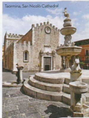
Taormina, San Nicolò Cathedral