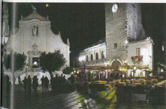
Piazza IX Aprile a Natale