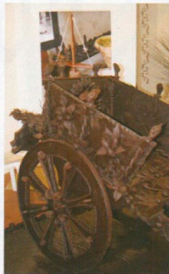
CiocolArt, Carretto