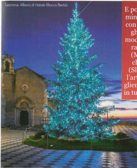
Taormina, Albero di Natale (Rocco Berté)

E poi c'è la Taormina di sempre, con i suoi alberghi classici e moderni, i ristoranti stellati (Michelin) e chiocciolati (Slow Food) e l'arte dell'accoglienza rinomata in tutto il mondo