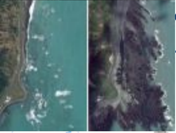
o sull'Italia: la ...