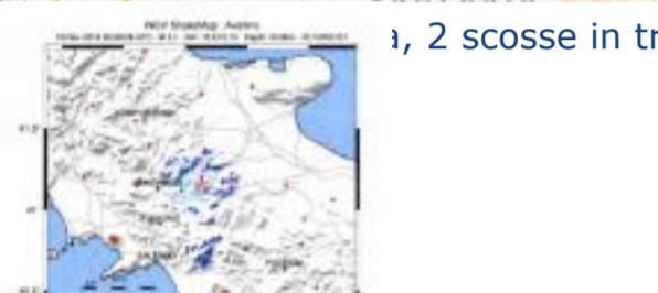
1, 2 scosse in tre minuti: paura ad Ariano Irp ...