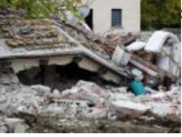
ossa in Grecia nella epi ...