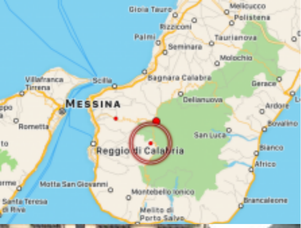
scosse in Aspromonte: continua l